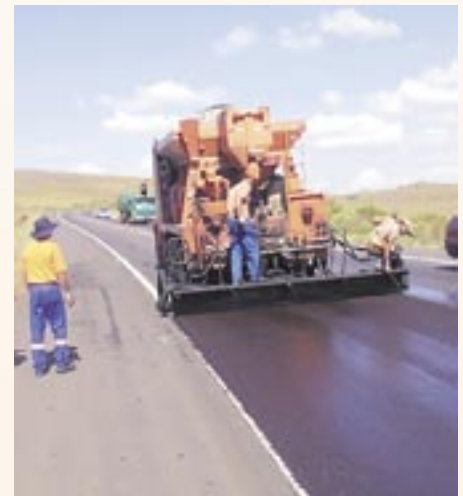
Execução micro BR 386 km 259

Outro fato inédito é de ser a primeira empresa do ramo de concessões rodoviárias a desenvolver um sistema próprio de arrecadação. Consiste basicamente em um banco de dados que armazena o nº da placa e a imagem digitalizada do veículo que passa por alguma de suas 13 praças de pedágio. Entre as vantagens, o Univias destaca a