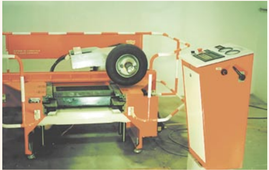
Mesa compactadora LCPC

Em termos de simulação de laboratório, os ensaios de creep estático e de creep com cargas repetidas são bastante difundidos devido à possibilidade de utilização de