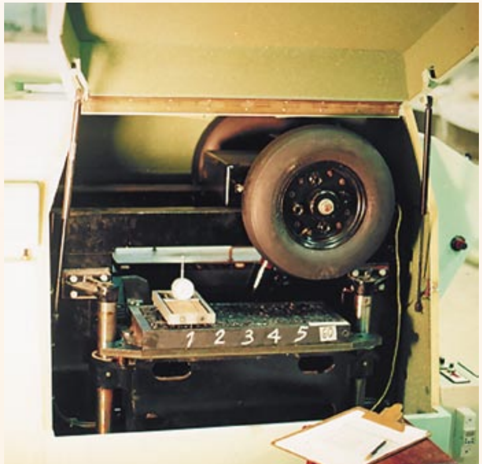
Simulador de tráfego

Após esse arrazoado inicial, perguntamo-nos então, se nosso objetivo final é a mistura asfáltica, qual o efeito de cada ligante no