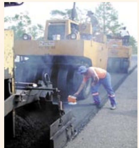
Execução Asfalto Borracha BR 290 km 305 - ligante Greca

redução no tempo de atendimento nas cabines de cobrança; e a segurança dos usuários - em caso de busca a veículos roubados, o banco de dados reconhece placas devidamente cadastradas.