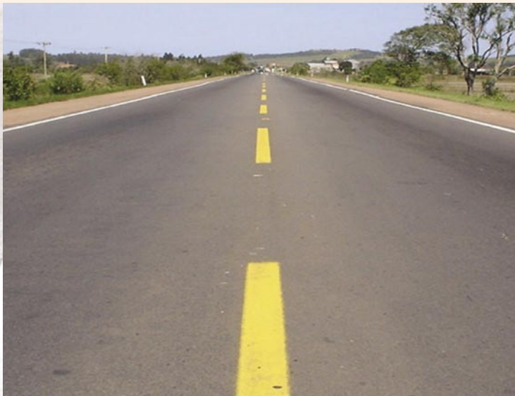
Trecho experimental – BR 116/RS – 3 anos – Asfalto borracha