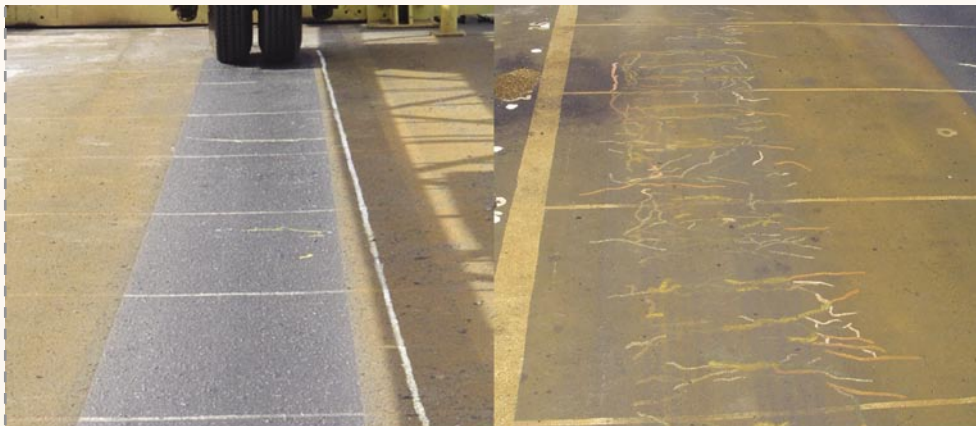
Asfalto Borracha com 300.000 ciclos