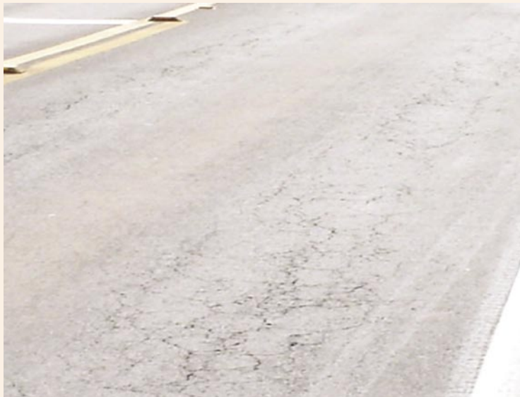
Trecho experimental – BR 116/RS – 3 anos – Asfalto convencional

Um estudo dos mais importantes sobre o Asfalto Borracha, a nível nacional e até mesmo internacional, é o que vem sendo desenvolvido desde julho de 2003 na Área de Pesquisas e Testes de Pavimentos